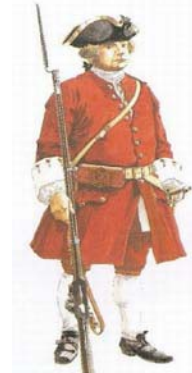
Figure 9-4-1 Compagnies franches britanniques – 1698 à 1717