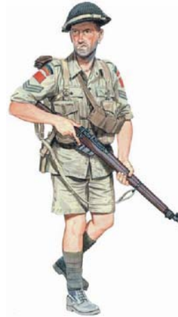
Figure 9-4-5 Infanterie canadienne Hong Kong – 1941