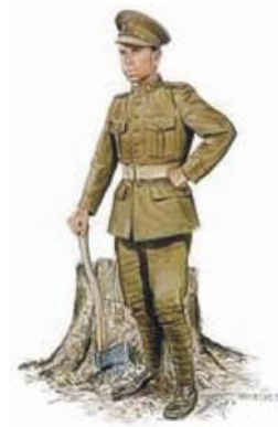
Figure 9-4-7 Corps expéditionnaire canadien – 1915 à 1916